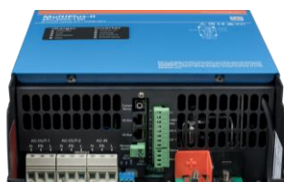
Área de conexión MultiPlus-II 3k